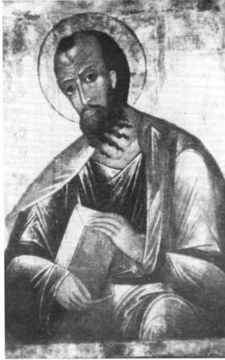
Св. апостол Павел. Икона нач. XVI века.

"Мы находились уже выше второй тверди... — продолжает описы-