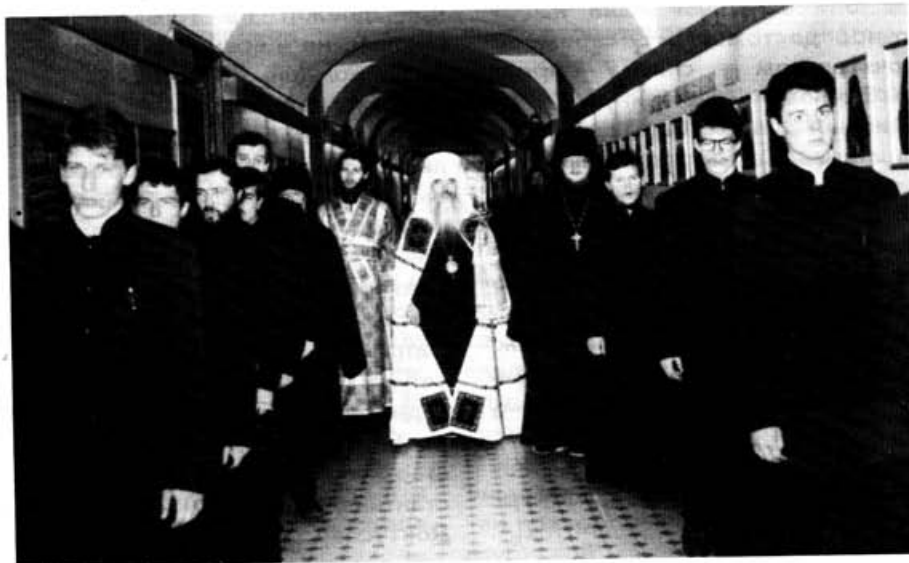
На праздник преподобного Сергия богослужение в храме МДА возглавил митрополит Минский и Слуцкий Филарет

годня действительно для меня счастливый день, когда я вновь в стенах Московской Духовной Академии и я вновь чувствую себя студентом. Вы стремитесь к познанию богословия и должны помнить о том, что путь к богословию — это не знания о Боге, а жизнь в Боге, и путь к богословию — это молитва. Молитвами преподобного Сергия вы должны научиться молитве. И эта молитва, искренняя и теплая, которая будет исходить из ваших юных сердец, приведет вас к боговедению. Я уезжаю от вас, согретый вашей любовью. Спасибо вам."