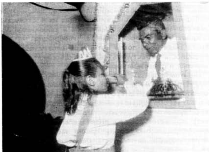
Наркотический чай дают пить даже детям

Особенно пышным цветом секта расцвела в конце 80-х годов, когда к ней присоединились известные