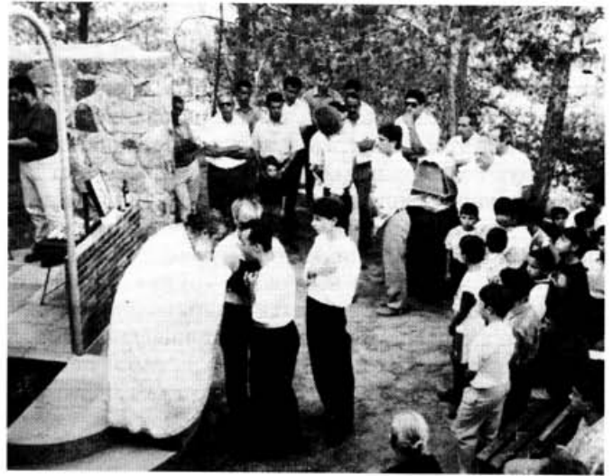
Храм под открытым небом

Совершенно особое впечатление произвел на нас распорядок, по которому строился каждый день жизни этого лагеря. Точнее сказать, не распорядок, а содержание каждого дня. В 6.30 подъем и сразу зарядка, после которой около двадцати минут отводится на умывание, и все собираются в храме на утреннюю молитву, которая оканчивается семиминутной проповедью лидера по прочитанному стиху из Евангелия. Далее дежурный отряд готовит трапезную к завтраку, а после него все трудятся по благоустройству лагеря. Примерно в 10 часов с детьми по отрядам вожатые проводят беседы, которые тоже длятся не более десяти минут. После беседы дети обычно играли в интеллектуальные игры (шахматы и т.п.) до 11 часов, когда всех угощали сладостями. Немного подкрепившись, кто-то торопился на стройплощадки, кто-то продолжал игры, кто-то находил себе собеседника. По зову била дети собираются на обед около 14 часов. За обедом бывают некоторые объявления, а заканчивается он обязательно христианскими молодежными песнями. В это время дня находиться под палящим солнцем просто невозможно, поэтому из трапезной все расходится по своим палаткам на двухчасовой отдых. А просыпаются под музыку, снова спешат за