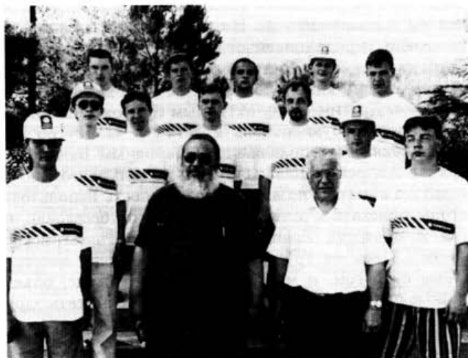
Беларусо-польская группа православных студентов на Кипре

Очень часто в различной церковной литературе можно встретить наименование Кипрской земли "Островом Святых". Безусловно, такое название этот небольшой остров в Средиземном море получил прежде всего за то, что кипрский народ, одним из первых приняв христианство, сохранил живую веру во Христа и