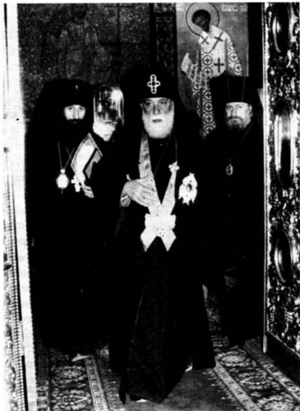
Патриарх-Католикос Грузинской Церкви в МДА

На прощание Его Святейшество Илия II сказал: "Ваше Преосвященство, дорогой Владыка Ректор, дорогие учащие и учащиеся! Се-