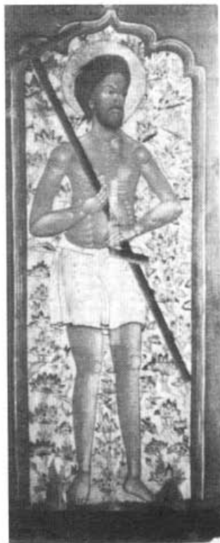
Благоразумный разбойник. Икона XVII века

Уникальное собрание Церковно-археологического кабинета Московской Духовной Академии оказывает на приходящего сюда человека совершенно особое воздействие. Все здесь подчинено единой идее церковности; каждый зал раскрывает перед нами ту или иную сторону красоты и богатства церковного искусства. Мы чувствуем это отчетливее всего там, где представлена древняя иконопись. "Входя в эти залы, — писал один из основателей ЦАКа, профессор протоиерей Алексей Остапов, — испытываешь радость общения с миром прекрасного и мудрого. Здесь особый воздух и свет. Четкие и плавные линии красноречивее слов, а глубокие глаза ликов льют в сердце радостное утешение надежды, кротость и правду о тебе самом..." 1