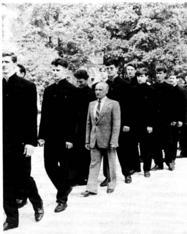
Профессорско-учащаяся корпорация на традиционном шествии в Троицкий собор

Во время работ, в Духовском храме совершалось чтение Псалтири. Все добросовестно, как бы отрешившись от внешних забот трудились, и хотя никто не искал особых знамений, внезапно стал