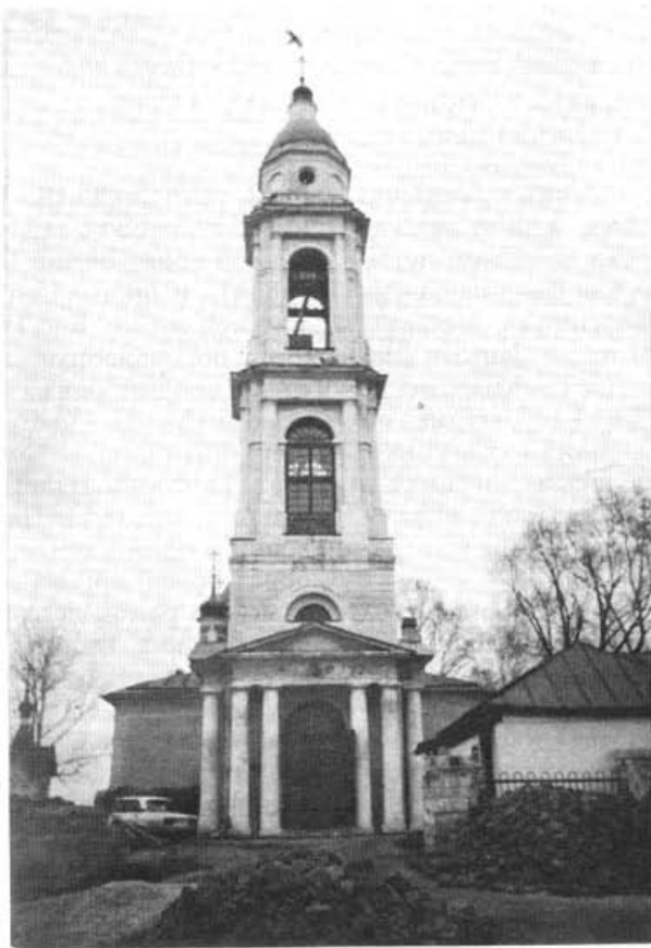
Михаило-Архангельский единоверческий храм в Михайловской слободе

Всесвятая и Живоначная Троица — Отец, Сын и Святой Дух — да утвердит православное единомыслие употребляющих равноспасительные старые и новые обряды, и да пребывает среди всех нас любовь Христа Господа, Который умер за всех нас, дабы мы примирившись с Богом наследовали жизнь вечную.